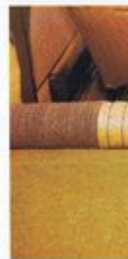
Abrundung des g... Ablage hinter der...