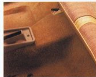
Komfort im Fußraum durch den festverlegten Teppichboden in Moquette. Natürlich farblich abgestimmt auf die Innenausstattung und von dauerhafter Qualität.