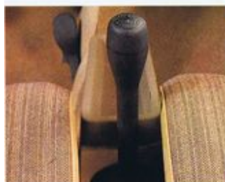
Der handfeste Schaltknopf mit dem Gangschema erfreut die Fahrer beider Modelle.