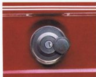
Sehr zeitgemäß: Der abschließbare Tankdeckel für „Red“ & „Brown“.