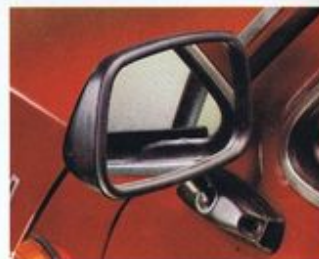
Verbesserter Überblick durch große und strömungsgünstige Außenspiegel – zur erhöhten Sicherheit im „Red“ & „Brown“.